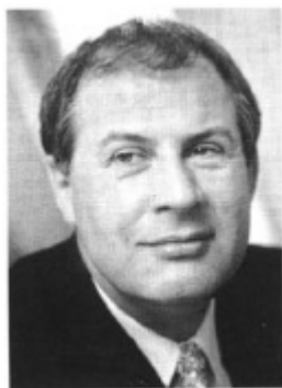
Président d'honneur James Bowman

James Bowman est l'un des contre-ténors les plus en vues et des plus influents au monde. Sa carrière se partage entre l'opéra, l'oratorio, la musique contemporaine et les récitals. Après une éducation à Oxford, il fait ses débuts avec Benjamin Britten en 1967 et devient très rapidement en demande tant sur les scènes d'opéra qu'en concert. Il apparaît à Glyndebourne en 1970, au English National Opera en 1971 et à Covent Garden en 1972. Parmi ses nombreux engagements à l'opéra à l'étranger, mentionnons l' Opéra de Paris , La Scala de Milan, La Fenice de Venise, et le Festival d'Aix-en-Provence . Il a reçu récemment La Médaille de la Ville De Paris en reconnaissance pour sa contribution de longue date à la vie musicale.